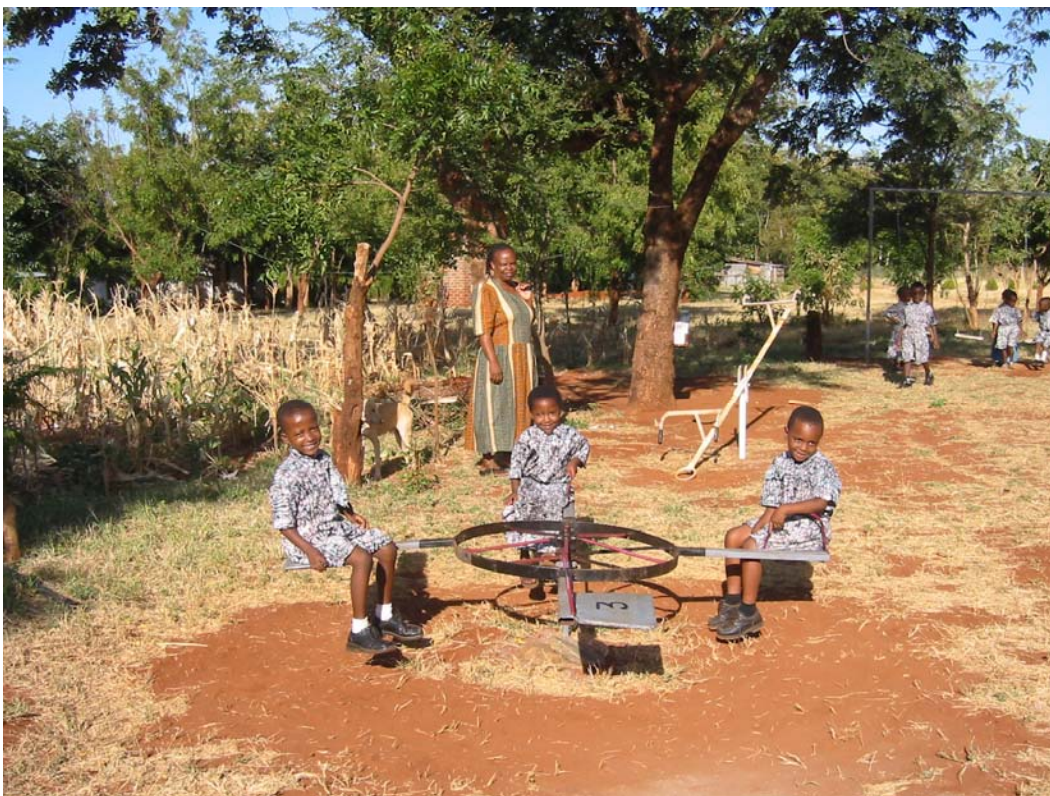
Mama Grace im Schulgarten. Man sieht die ländliche Umgebung