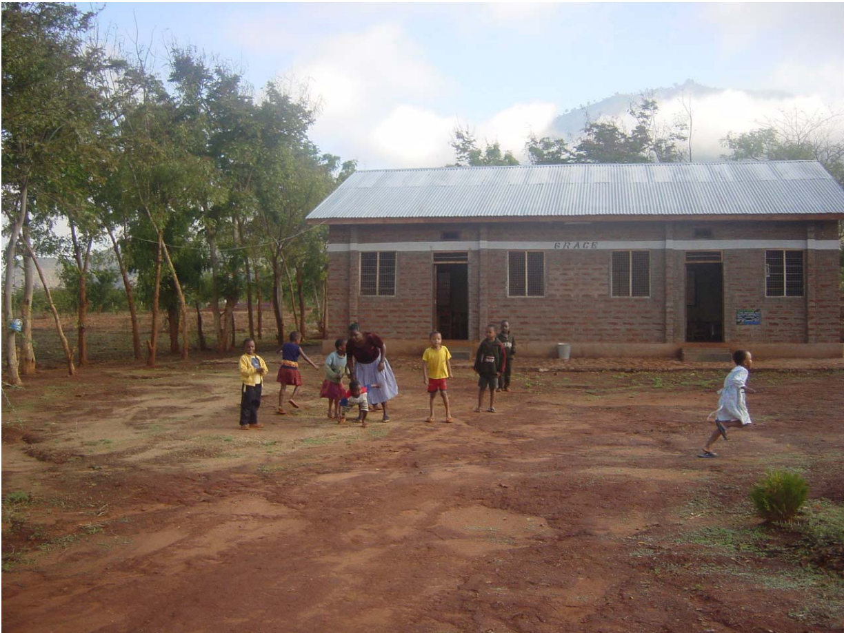
Spielen toben und lernen in ländlicher Umgebung mit Betreuung