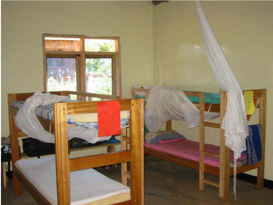
Die Kinder schlafen unter hygienischen Bedingungen in kindgerechtem Umfeld.

Sie können die Patenschaft beim Rotary Club Mühldorf-Waldkraiburg einzahlen und erhalten dafür eine deutsche Spendenquittung für Ihre Steuererklärung. Ihre Spende wird vollständig, ohne Abzüge oder Verwaltungsaufwand über den Rotary Club direkt an die Schule für Ihr Patenkind überwiesen. Wenn Sie möchten, erhalten Sie Hintergrund, Adresse und Fotos Ihres Patenkindes und können in einen persönlichen Kontakt treten. Es sind schon viele fruchtbare, echte Patenschaften entstanden. Vielen Dank im Namen der Kinder!