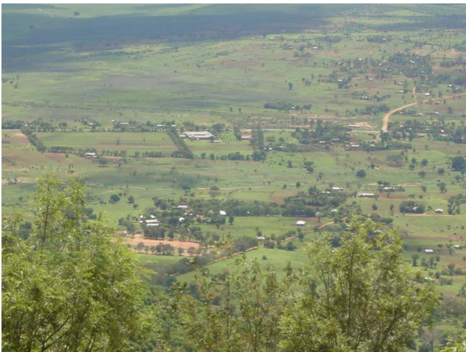
Kisangara von Oben