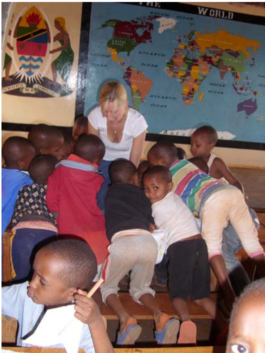
Vielen Dank im Namen des Schulvereins und der fröhlichen Kinder