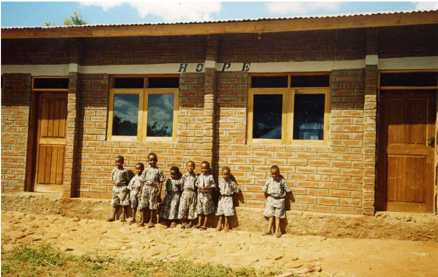
Ein Klassenzimmer von außen. Nebenan wurde die neue Aula gebaut.